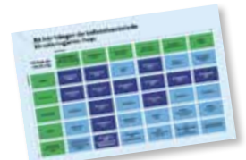
Vilken försäkring för vem? Sid 18.

av männen inom kommun/region som drabbas av långvarig sjukfrånvaro är över 45 år. Sid 5.