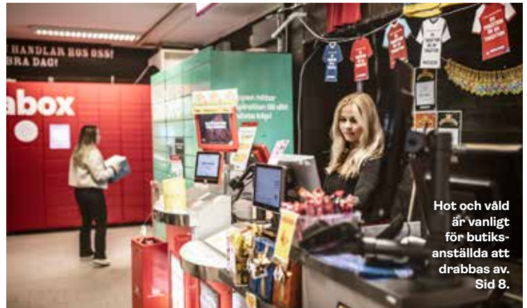
Hot och våld är vanligt för butiksanställda att drabbas av. Sid 8.