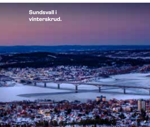
Sundsvall i vinterskrud.