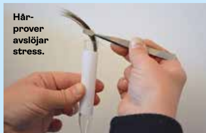
Hårprover avslöjar stress.

– Vi kontaktade kardiologklinikerna på tre större sjukhus och deltagarna fick svara på samma frågor som i Scapisstudien. När de skrevs ut analyserade vi